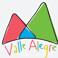
JARDÍN INFANTIL VALLE ALEGRE