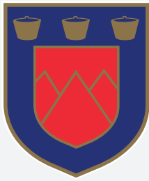
COLEGIO LOS ANDES