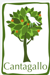
PRE ESCOLAR CANTAGALLO