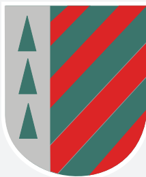
COLEGIO LOS ALERCES